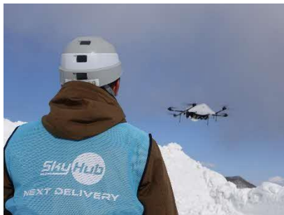
新十津川町上空を飛行するドローン