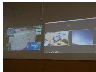
東京・虎ノ門からの遠隔操作