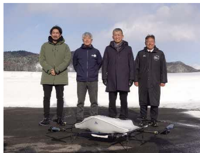
実証実験のドローン配送を 終えて記念撮影