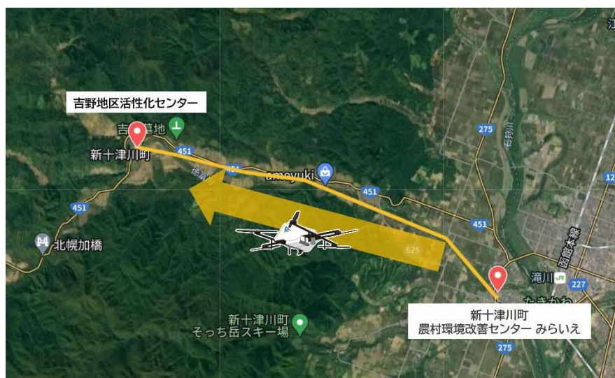
市街地から吉野地区へドローンによる救援物資配送を実施

地震などの災害時、土砂崩れなどで道路が寸断された場合、中心部から少し離れた町の西側に位置する吉野地区は陸路ではアクセスできず、孤立してしまう可能性があるため、そうした際に、ドローンを活用して空から物資を届けることを想定し、実証実験を行いました。(片道飛行 距離約 13.4km、約 35 分)