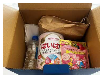
ドローン配送された救援物資

※上図は新十津川町内の飛行ルートを Google が提供する Google Map を使用し表示したものです。